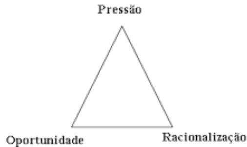
Figura 1 - Triângulo da Fraude

Cressey efetuou entrevistas a 250 pessoas que cometeram fraude, num período de 5 meses. Com este estudo, o autor descobriu que há três fatores que leva uma pessoa a cometer a fraude: pressão, oportunidade e racionalização (Figura 1).