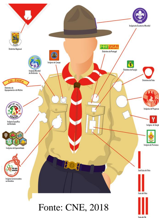
Figura 9 – Uniforme Escutista

O uniforme pode ser consultado na Fig.9. O elemento pedagógico que identifica o Escutismo foi criado por Baden-Powell, o chamado método escutista, um sistema de auto-educação progressiva baseado na Lei e Promessa e em sete elementos igualmente relevantes (ver Fig.10).O objetivo educativo do escutismo é constituído pelas capacidades (conhecimento, competências e atitudes) e pelas necessidades e aspirações dos jovens em cada uma das seis áreas de desenvolvimento pessoal: físico, afetivo, carácter, espiritual, intelectual e social (Fig.11).