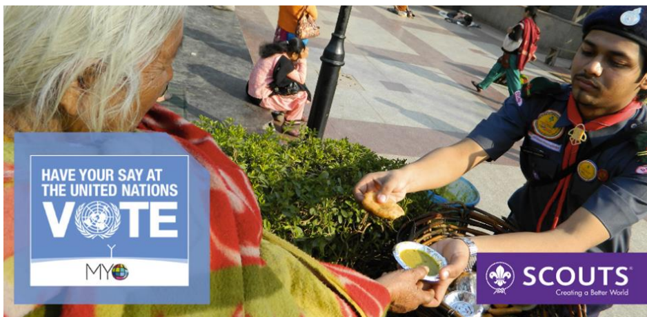
Figura 3 - Campanha Mundial de Envolvimento de Escuteiros com os ODS, através da Parceria entre a ONU e a OMME