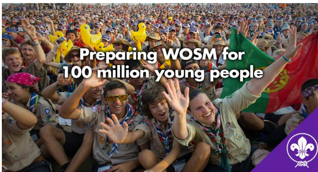
Figura 4 - Campanha Mundial da OMME com o intuito de permitir a 100 milhões de jovens uma cidadania ativa através do Escutismo

2023 o Escutismo ser o movimento líder mundial na educação de jovens, permitindo que 100 milhões de jovens sejam cidadãos ativos, atores de mudança positiva nas suas comunidades e mundo, através do sistema comum de valores. Com efeito, a OMME pretende que os jovens sejam educados para desempenharem um papel construtivo na sociedade, ao mesmo tempo que criam um mundo melhor (Conferência Mundial do Escutismo, Liubliana, 2014). Nesta conformidade, foram adoptadas na mesma conferência seis prioridades estratégicas para o movimento, que agora vigoram e dizem respeito aos métodos educativos, à diversidade e inclusão, à participação jovem, ao impacto social, à comunicação e relações externas e à boa governação. Na mesma conferência, foi aprovado o rascunho do que viria a ser o Plano de Ação Trienal 2017-2020, referido no sub-capítulo anterior, e finalizado pelo Comité Mundial do Escutismo, tendo sido assim adoptada oficialmente a nova estratégia do Movimento, bem como os seus objetivos e meios de execução. (OMME, 2014)