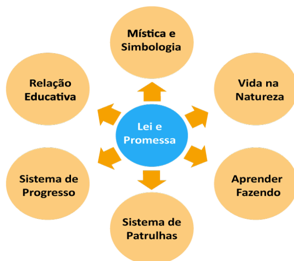
Figura 10: Método Escutista