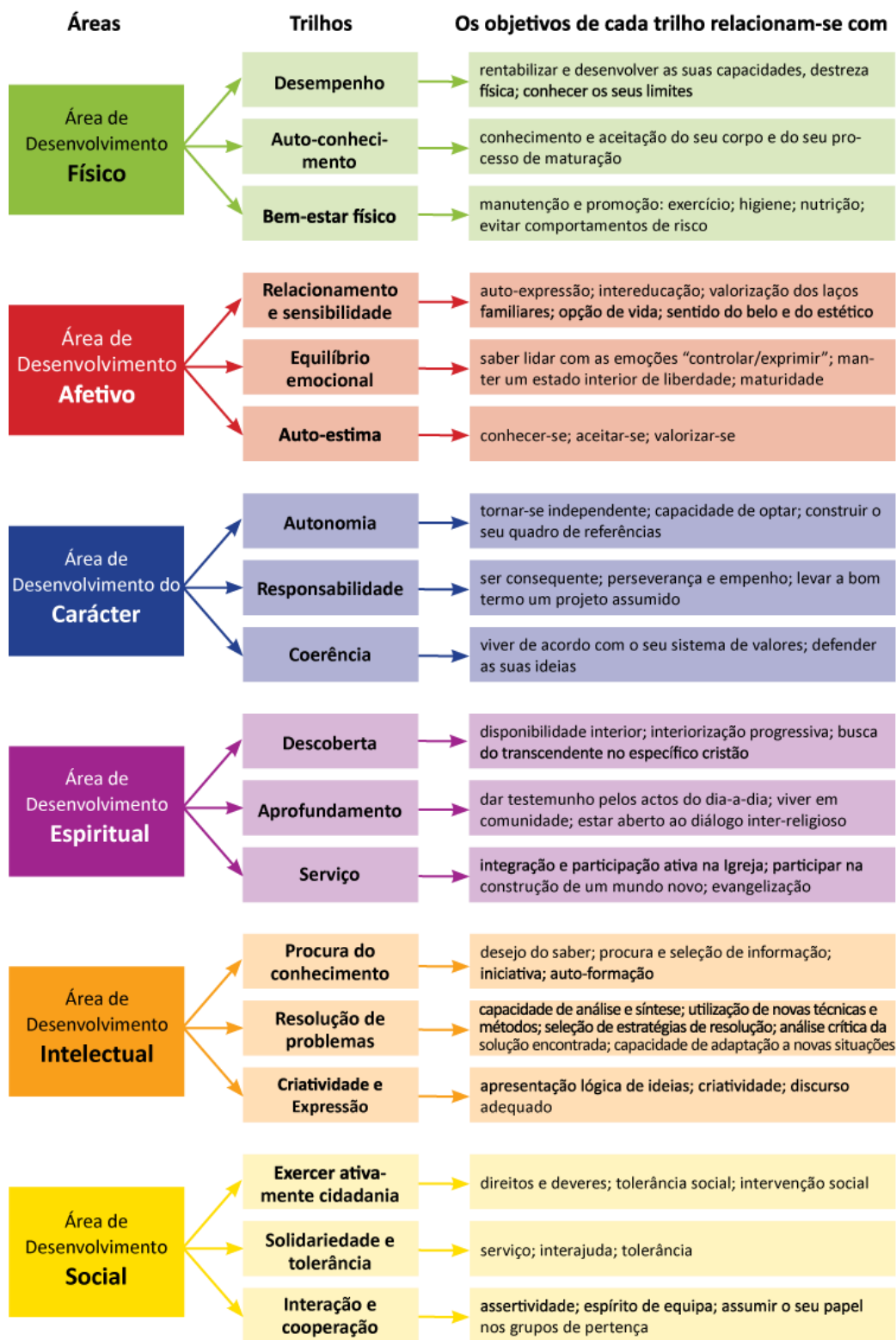
Figura 11: Objetivos Pedagógicos do CNE