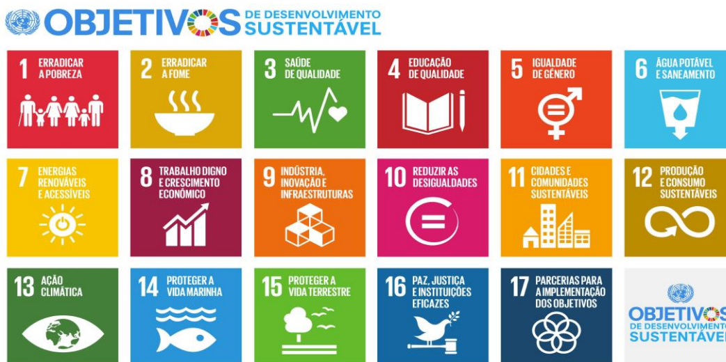
Figura 1 – Os Objetivos do Desenvolvimento Sustentável da ONU