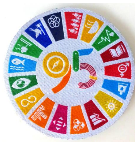
Figura 13: Insígnia do CNE do desafio da concretização dos ODS