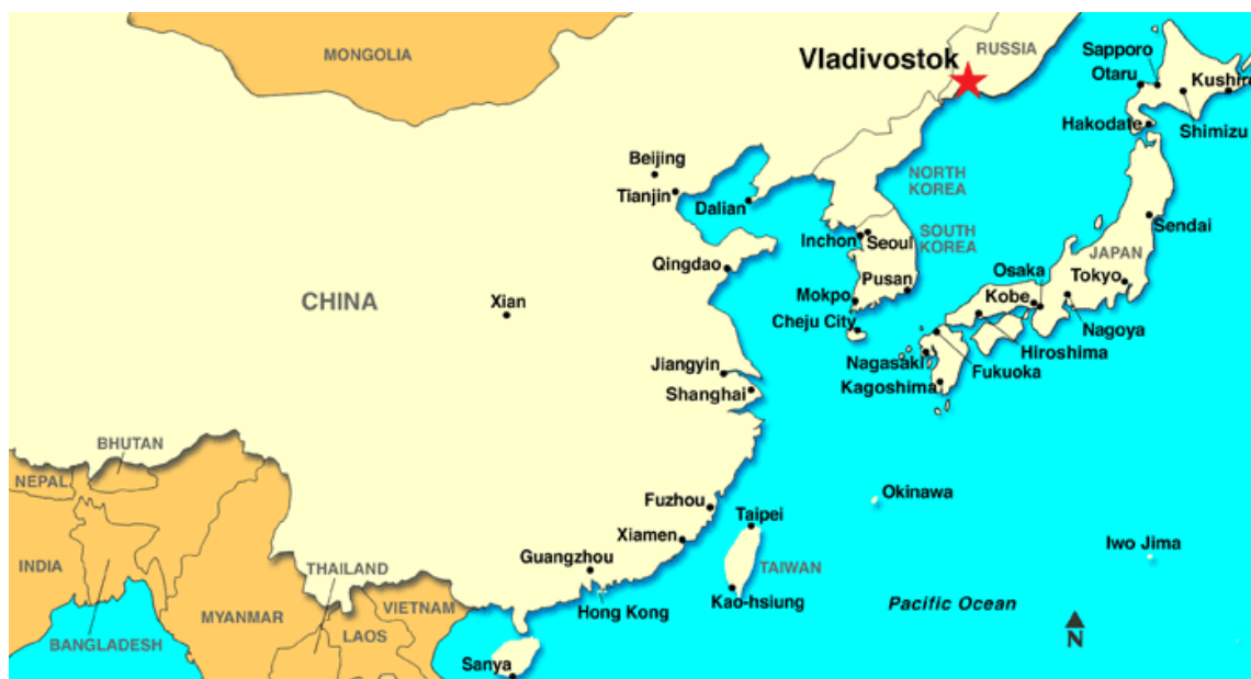
FIGURA 1 - Vladivostok na Ásia-Pacífico

Kong e Busan, pelo volume de carga operada (Ren, 2019), e Macau, pelo regime fiscal oferecido (The Siberian Times, 2015). Especificamente, pretende-se que Vladivostok, ponto terminal do caminho-de-ferro transiberiano, que se inicia em Moscovo, se torne num centro que ligue a Europa à Ásia, tanto por via marítima, como por via férrea de longa distância (Portstrategy, 2012).