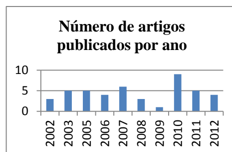
Figura 2: Número de artigos publicados

Através da listagem de artigos (Tabela I), constata-se que as duas revistas científicas com mais publicações sobre o coaching e o coaching executivo são a Leadership & Organization Development Journal e a Journal of Management Development , com 8 e 7 artigos publicados, respectivamente, entre 2002 e 2012. Existem também, outras revistas científicas que publicaram mais que um artigo sobre o tema ao longo da última década, como a International Journal of Mentoring and Coaching in Education e a Personnel Review , com 2 artigos publicados, cada uma. A listagem de artigos permitiu verificar que foram publicados mais artigos na segunda metade da década, considerando os anos de 2008 a 2012, onde foram publicados 28 artigos, enquanto que na primeira metade da década, foram publicados 23 (Figura 2). Verificou-se ainda que foi durante o ano de 2010 que foram publicados mais artigos científicos e mais informação sobre o coaching e o coaching executivo, com 9 artigos publicados. O segundo ano em que foram publicados mais artigos foi o ano de 2007, com 6 artigos sobre a temática deste trabalho (Figura 2). O ano de 2004 não foi contemplado, pois não foram considerados estudos científicos neste período para a construção da matriz de análise.