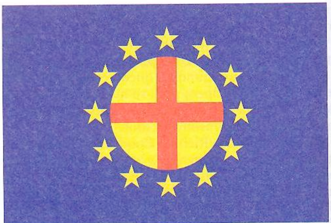
Bandeira proposta no texto Pan-Europa