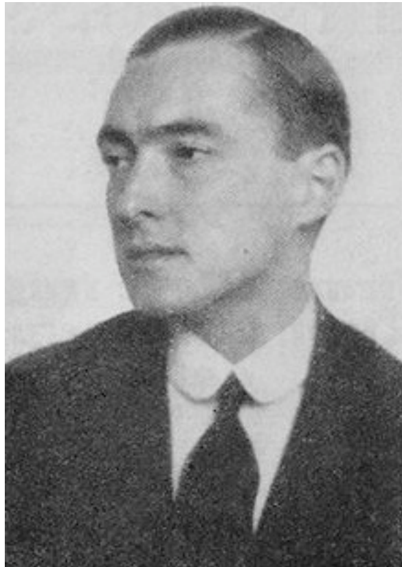
Richard Coudenhove- Kalergi (1894-1972)