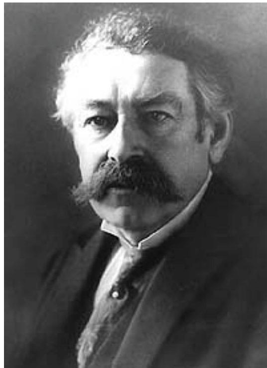
Aristide Briand (1862-1932)