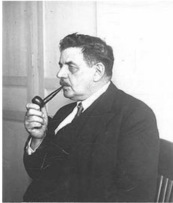
Edouard Herriot (1872-1957)