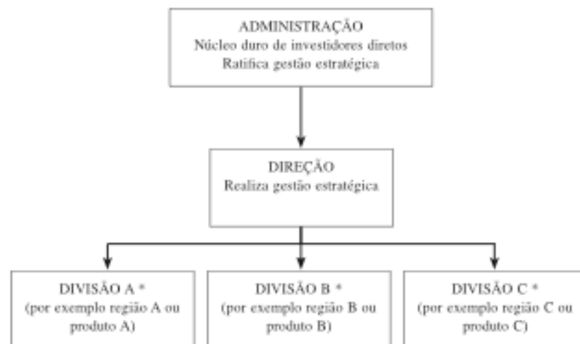
Figura 5.1 — Organograma de uma empresa descentralizada e organizada em divisões