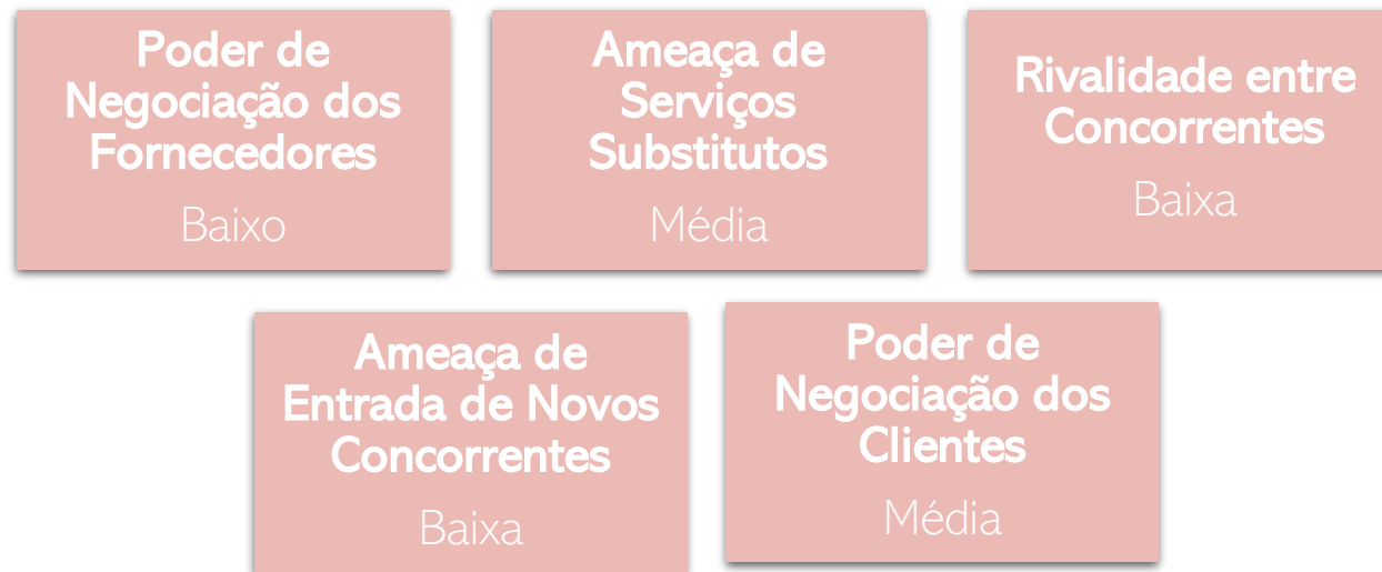
Figura 2 – Modelo das 5 Forças de Porter

A indústria em que a Associação Sara Carreira se insere pode ser definida como o setor do terceiro setor ou da economia social, que engloba organizações sem fins lucrativos dedicadas a causas sociais e humanitárias. Este setor abrange uma ampla gama de organizações, incluindo associações de apoio à educação, à saúde, à inclusão social, entre outras. No caso específico da Associação Sara Carreira, a indústria seria aquela relacionada com a promoção da educação e do desenvolvimento de jovens talentosos provenientes de meios desfavorecidos.